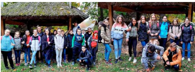
FOTÓK: ARANY JÁNOS ISKOLA

2021. október 13-án a 7. évfolyam tanulóival kiránduláson vettünk részt. Még az őszi jó időt kihasználva busszal indultunk Nyíregyházára a Sóstói Múzeumfaluba. Itt a számtalan látnivaló mellett lehetőségünk nyílt különleges kézműves programok lebonyolítására is. Így a gyerekek két csoportban felváltva megismerhették a gyertyamártás és a bőrkészítés fortélyait. A múzeum területén körbehaladva megtekinthettük a régi építészeti stílusokat és a házak berendezéseit. Képelemben átléphetünk a régmúlt embereinek szokásait, hagyományait. A tartalmas program után jutott idő egy kis vásárlásra, majd elfogyasztottuk a jól megérdemelt ebédünket. A kellemes nap után fáradtan, de feltöltődve értünk haza.